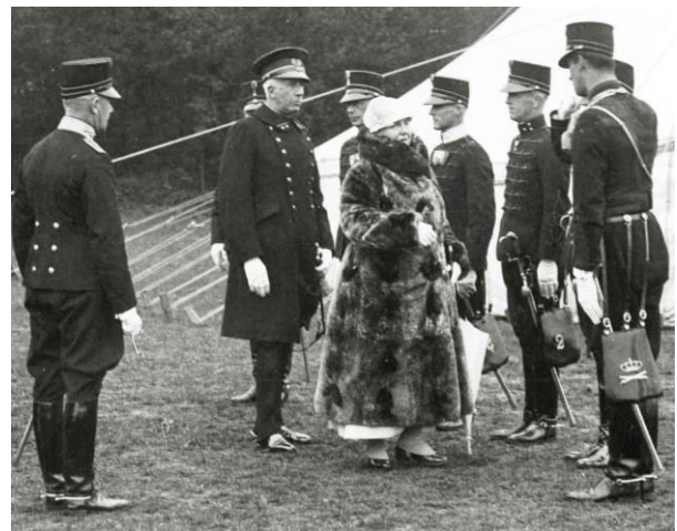
H.M. Koningin Wilhelmina bezoekt de dressuurproeven op Landgoed Duinrell in Wassenaar bij het Gouden Jubileum van de KMSV op 24 april 1936, bij welke gelegenheid zij het Beschermvrouwschap van de vereniging aanvaardde