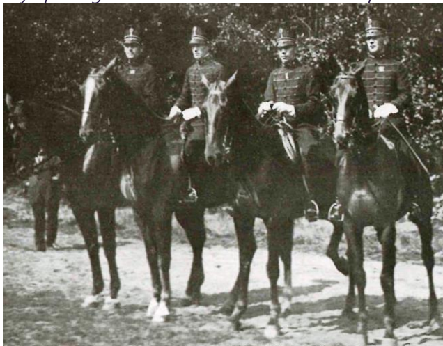
De Nederlandse équipe wint de 1 e prijs op de Olympische Spelen van 1924 in Parijs, van links naar rechts de Luitenants der Huzaren A.D.C. van der Voort van Zijp met Silver Piece , C.F. Pahud de Mortanges met Johnnie Walker , G.P. de Kruijff met Addio en A.C. Colenbrander met King of Hearts