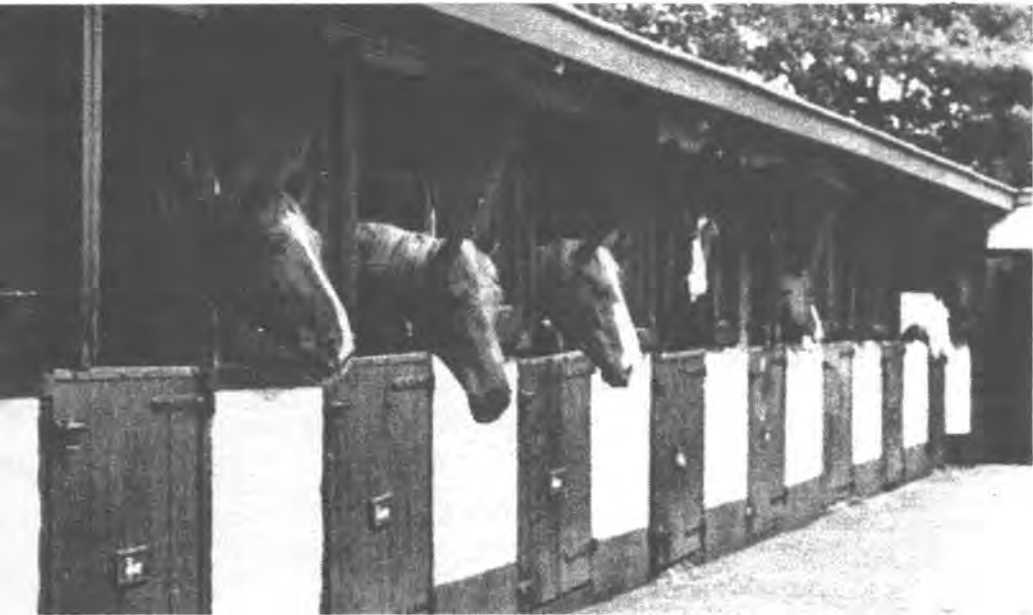
De stallen van Marcroix

Eind december 1961 stond onder de kop „Moderne Cavalisten te Paard” het volgende kleine artikeltje in de Hoefslag: „Het is interessant dat we hebben vernomen dat op de terreinen van de Bernhardkazerne te Amersfoort werkzaamheden verricht worden, nodig voor het bouwen van een paardestal. Het juiste is