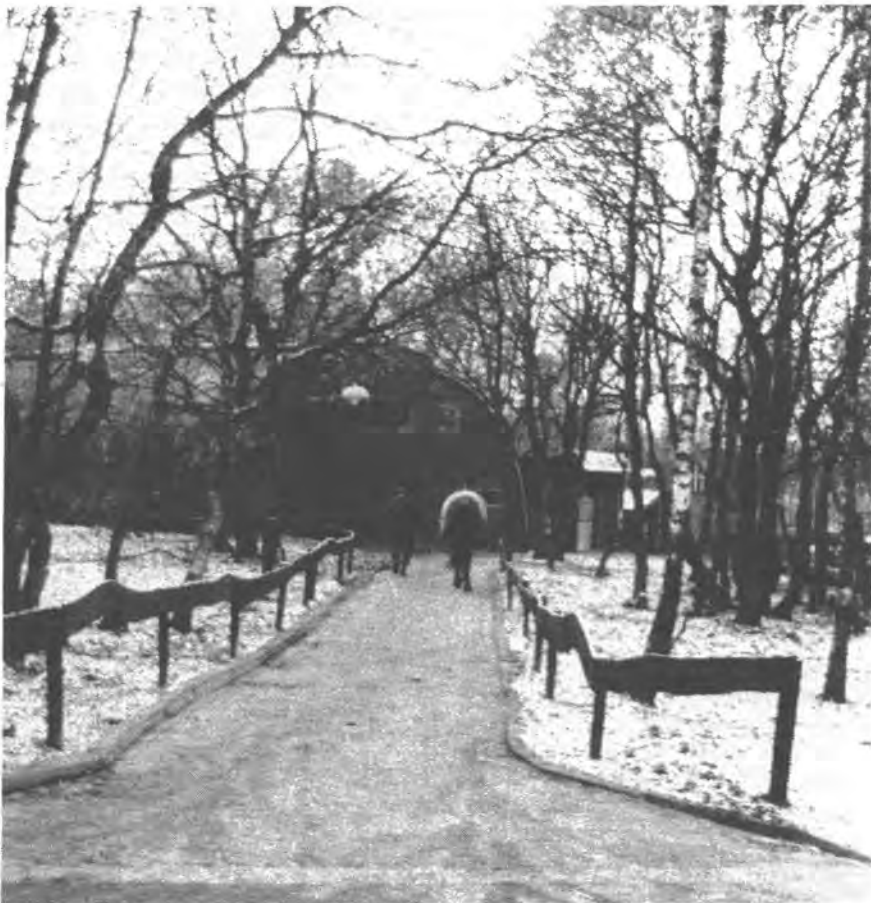
De 10 jaar oude manege, het kunstwerk van de „bouwpastoor”, waarvan thans vervanging noodzakelijk is.

minimum aan stalpersoneel nodig, omdat de privé-paarden door hun eigenaars verzorgd worden; het onderhoud aan terrein, stallen en gebouwen geschiedt veelal in eigen beheer.