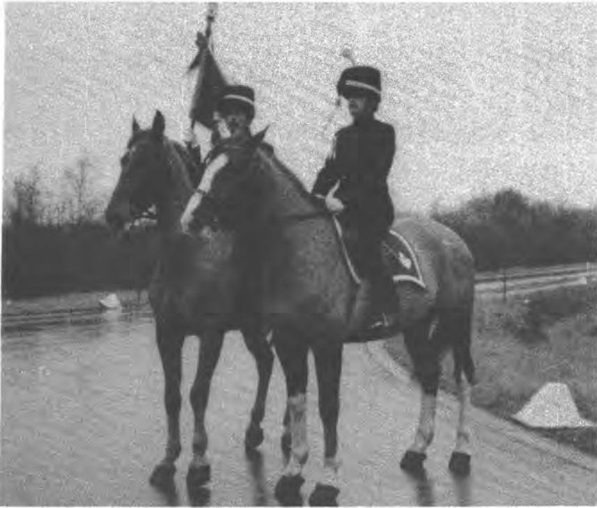
De oude standaard van het Regiment Huzaren Prins Alexander na de uitreiking van de nieuwe standaard door Z.K.H. Prins Bernhard op 5 december 1972.