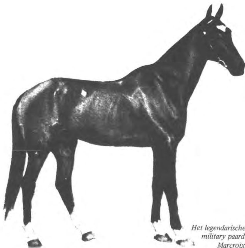
Het legendarische military paard Marcoix